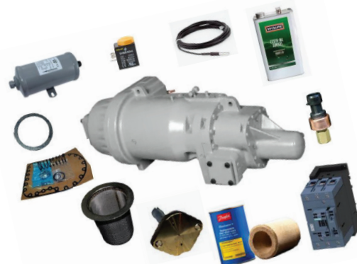
Kit pour compresseurs 06T