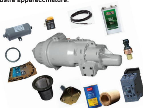
Kit per compressori 06T