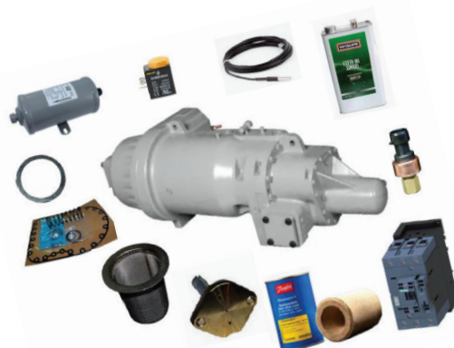
Kit för 06T-kompressorer